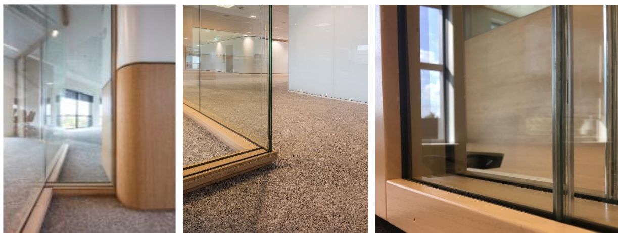
Woodvision Type 1 bevat flush overgangen tussen glaspanelen. Type 2 is voorzien van verticale stijlen.