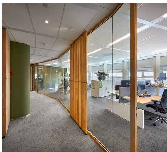
Verwol Biobased Woodvision

U kunt het hergebruikte glas toepassen met second life aluminium profielen of in combinatie met nieuwe Biobased Woodvision profielen. In beide gevallen een duurzame keuze!