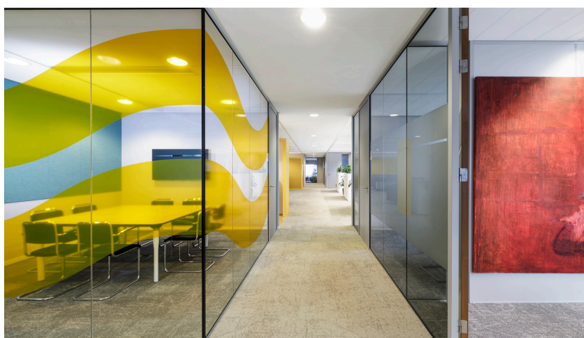
Verwol second life Clearvision