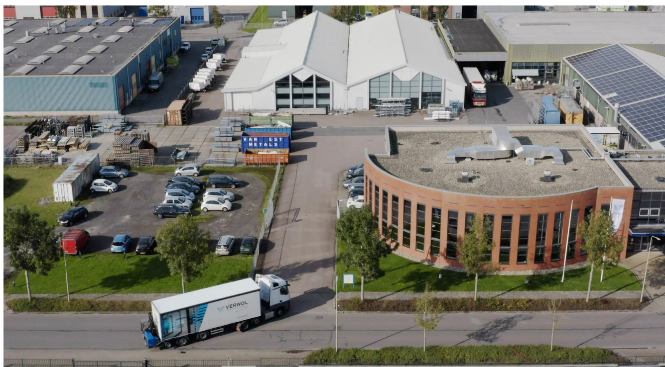
Hoofdkantoor Verwol Opmeer met productie/opslagfaciliteit (12.000m 2 )